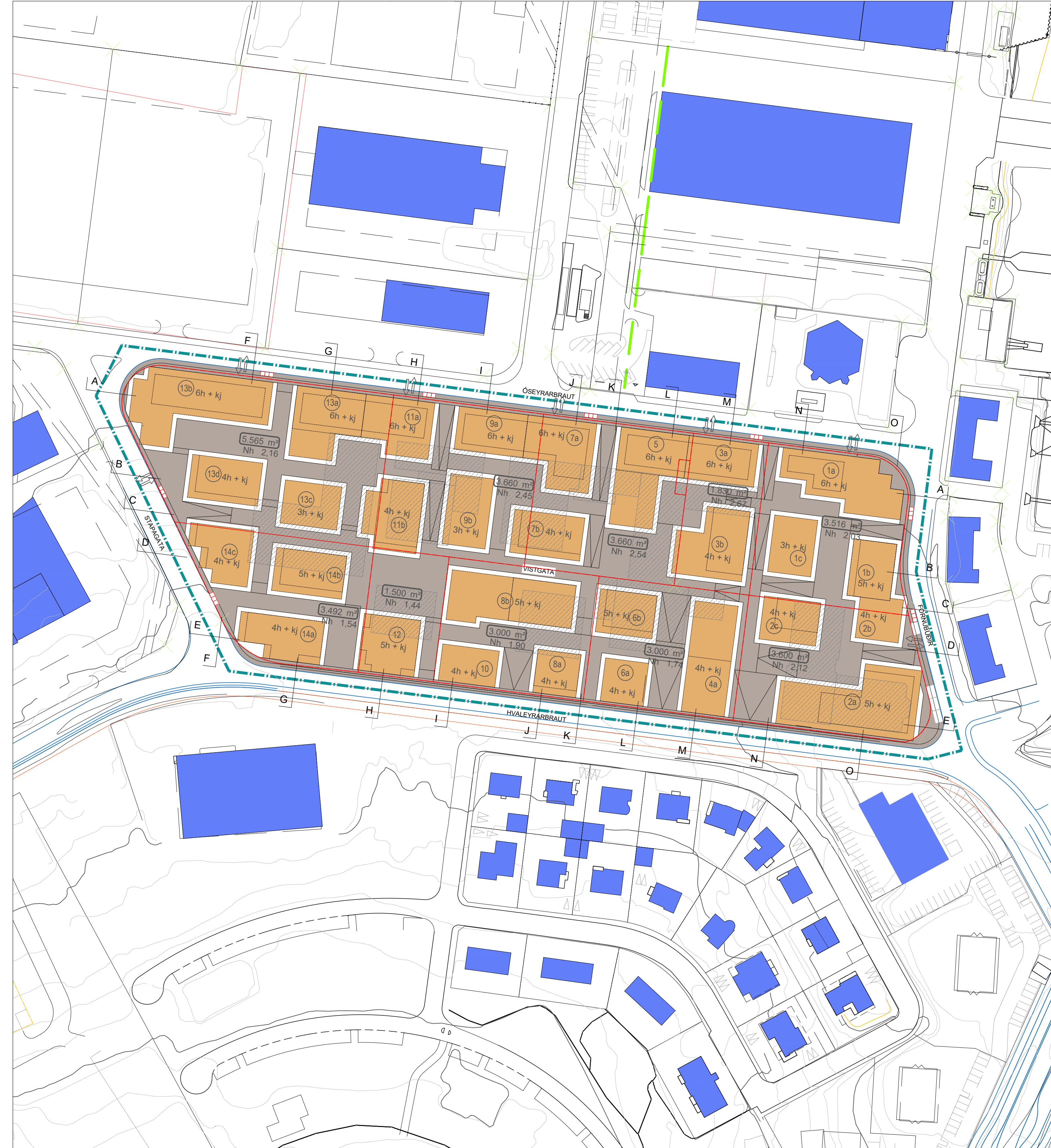
Tillaga að deiliskipulagi - mkv. 1:1000