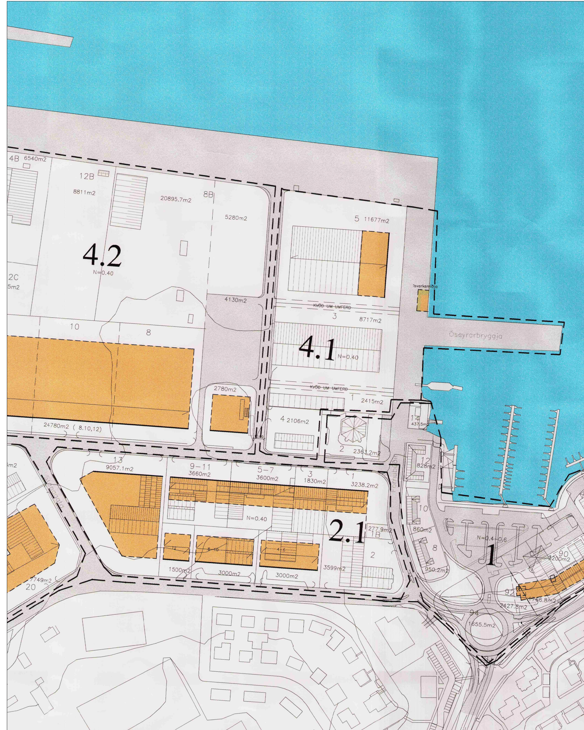
Gildandi deiliskipulag mkv. 1:2000. Nýtt deiliskipulag tekur yfir reit 2.1.